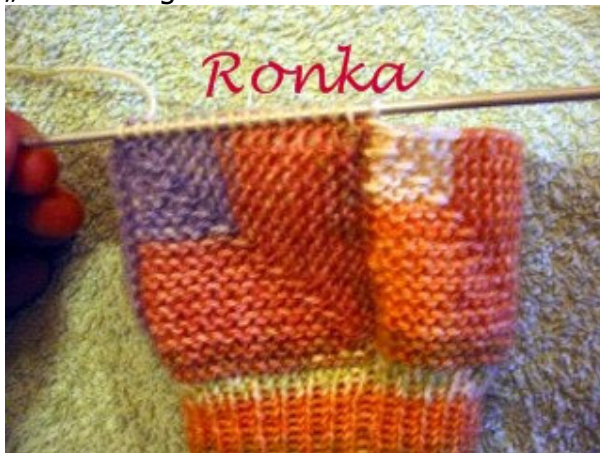
Für die nächste Quadratrunde 15 Maschen aus dem oberen Rand des 1. Quadrates aufnehmen = 16 Maschen, die Rückreihe rechts stricken,