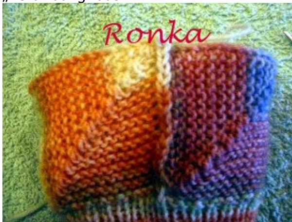
So sieht die linke Seite der „Verbindung“ aus.